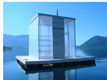
Plávajúca sauna, Nórsko 2002 Sami Rintala, Marco Casagrande, Christel Sverre

Na druhej strane plošiny sa nachádza priestor fungujúci ako miesto krátkeho odpočinku, alebo môže byť využitý na umeleckú inštaláciu vzťahujúcu sa k povesti Seljordského hada. Veža ma 3 miestnosti. Drevená trámová konštrukcia zabezpečuje stabilitu. Fasáda je pokrytá drevenými šindľami v tradícii kraja Telemark.