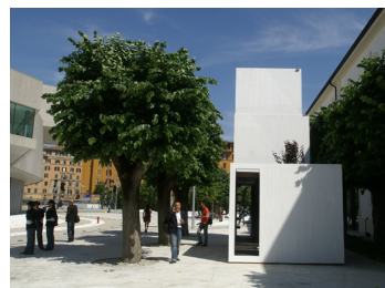
Cabinet Home Galeria MAXXI, Rim, Taliansko Sami Rintala

V historickom centre Montrealu bol postavený ocelový rám (kubus o rozmeroch 6x6x6 metrov), na ktorý bolo zavesených 10 kilometrov dlhých recyklovaných reťazi, používaných pre účely kotvenia morských lodí. V takto vymedzenom priestore sa nachádza ohnisko a štyri lavičky z masívneho pieskovca. Drevo na oheň je uložené pod sedacími lavičkami. Ide o projekt založený na jednoduchej skúsenosti: sedieť okolo ohňa, užívať si tepla a pozeráť do plameňa. Sled udalostí vytvára spoločnú pamäť. Okolo ohňa sa vytvára príbeh so spirituálnym podtextom. Siaknuté šaty jemným pachom dymu si ľudia odnášajú so sebou do neďalekých bánk a high-tech úradníckych budov a tým si odnášajú spoločnú prítomnosť do osobného života. Projekt vznikol v rámci umeleckého Biennale v Montreale v roku 2002. Vytvára bipolaritu spôsobu fungovania dnešnej spoločnosti low-tech verus high-tech.