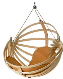
Jiella, závesné drevené kreslo 2008 Original Habitek Works, Finsko Samuli Naamanka

Sedem metrov dlhý železný trám bol zavesený medzi dve 16 metrov od seba vzdialené budovy pomocou rybárskych vlasov. Trám vážiaci 315 kg je umiestnený tesne nad zemou. V závislosti nad teplotnými zmenami aktuálneho počasia, ktoré zmršťujú alebo predlžujú vlasce sa trám voľne pohybuje.