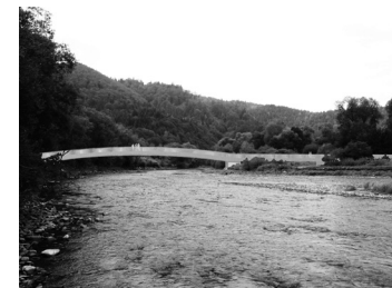
Premostenie obce Sulín-Zegiestov Irakli Eristavi (zerozero)

Jiella je závesné drevené kreslo využívajúce geometriu gule. Skladá sa z tvarovaných laminovaných laťoviek narezaných z jednej dýhovej dosky. Vnútoraná vrstva dýhy je brezová, povrch môže byť v prevedení jaseňa, orecha, duba alebo buka. Jednotlivé dielce sú spojené kovovým pántom. Priestorová geometria odpovedá požiadavkám ľahkého zloženia a prenosnosti. Balenie obsahuje drevené časti, kožený sedák, uchyťavacie pánty a návod.