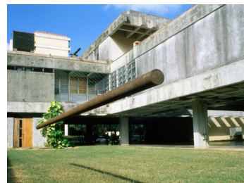
Quetzalcoatlus, Havana, Kuba 2000 Sami Rintala, Marco Casagrande

Projekt je výsledkom študentského workshopu Art Academy Bergen. Sauna poskytuje okrem fyzickej očisty jedinečný zážitok znásobený prírodným koloritom prostredia. Objekt tvorí kubusová rámová konštrukcia obalená transparentnou fóliou a postranným módom. Vstup je zabezpečený pod hladinou jazera. Interiér je vybavený stupňovitou sedacou lavicou a malou pieckou pre vytvorenie a udržiavanie potrebnej teploty v saune.