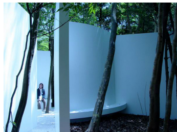
Lesná pozorovateľňa Kuyshu, Japonsko 2004 Sami Rintala

Architektúra je zrkadliacim javiskom osnosi majiteľa a tento projekt predstavuje utilitárne potreby užívateľa pri zachovaní architektonickej kvality.